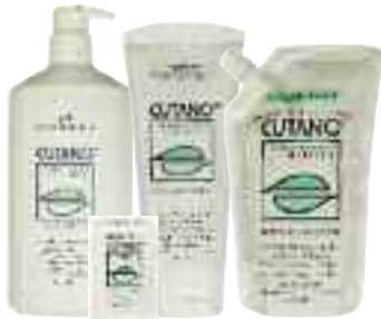
Waschpflege fest 100 g Waschpflege flüssig 200 ml Waschpflege flüssig 500 ml im Spender Waschpflege flüssig 500 ml im Nachfüllpack