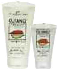
Pflegebalsam 150 ml Pflegecreme 50 ml