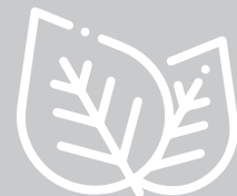
Sekundäre Pflanzenstoffe (Superfoods)