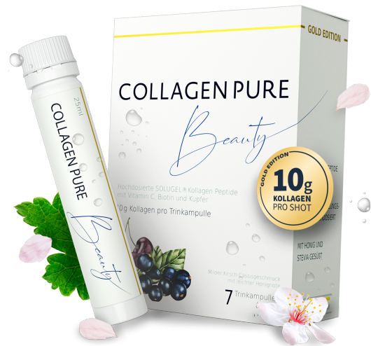
COLLAGEN PURE Beauty 10 g Kollagen Trinkampullen Inhalt: 7 x 25 ml. PZN: 16401385

**entsprechen einer 4-fach höheren Dosis als bei herkömmlichem Beauty Trinkkollagen