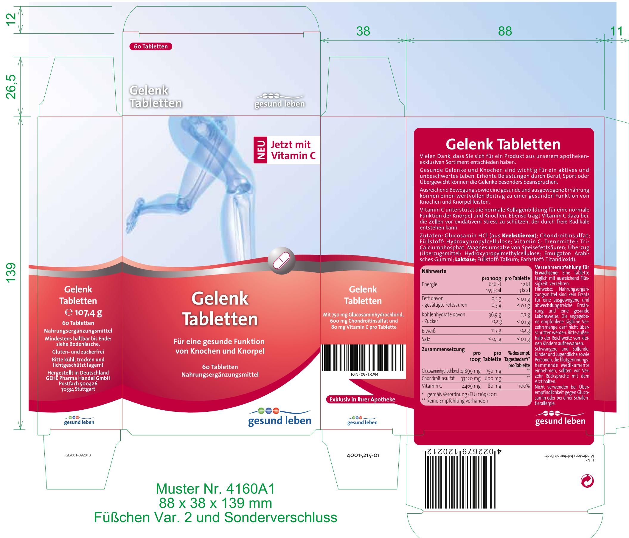
Muster Nr. 4160A1 88 x 38 x 139 mm Füßchen Var. 2 und Sonderverschluss