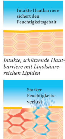
Intakte, schützende Hautbarriere mit Linolsäure-reichen Lipiden

Gleichgültig ob innere oder äußere Ursachen vorliegen, die Folge ist immer gleich: eine trockene, gereizte oder irritierte Haut, die verstärkt zu Entzündungen, Juckreiz und Ekzemen neigt. Um den daraus resultierenden Belastungen entgegenzuwirken und die Kopfhaut vor weiteren Schäden zu schützen, ist die einzigartige Formulierung der Linola PLUS-Serie mit Linola PLUS Creme , Linola PLUS Hautmilch , Linola PLUS Kopfhaut-Tonikum und Linola PLUS Shampoo entwickelt worden. Weitere Informationen stehen für Sie bereit unter www.linola.de