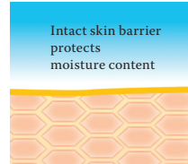
Intact protective skin barrier with lipids rich in linoleic acids.

corneocytes connecting them flexibly with each other. This forms a structure like a brick wall which denies bacteria and harmful substances a chance to penetrate our skin. However, if the structural lipids are removed by too frequent washing, showering or swimming or if they are not produced in sufficient quantities, as is the case in ageing skin or atopic eczema, then the corneocytes become detached from each other and holes develop in the skin's protective barrier.